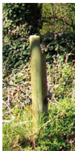
Le chemin du vallon du Grangent sera repris dans sa partie basse